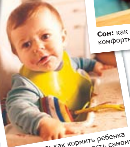
Кормление: как кормить ребенка и помочь ему научиться есть самому.